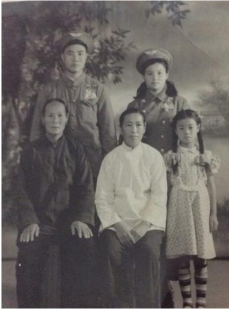
双方母亲和詹家小妹郑州合影

中一个三岁的男孩儿患了肺炎，部队里药品不全，情况很紧急。军分区开汽车去开封市买来特效药——油质盘尼西林（青霉素）。我经过皮试、配制，给孩子注射了三天。孩子得救了。