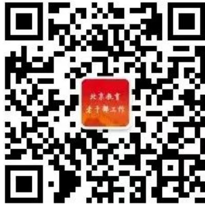
北京教育老干部工作