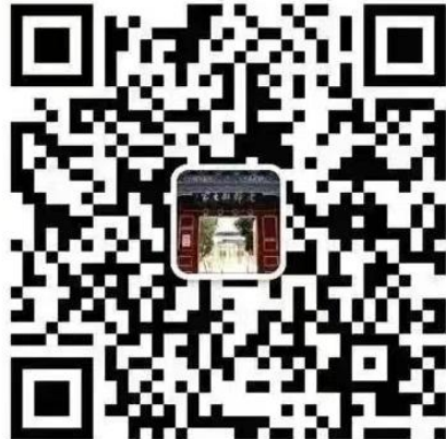
教育部老干部之家