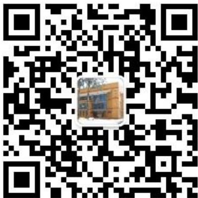
北京科技大学离退休职工党委