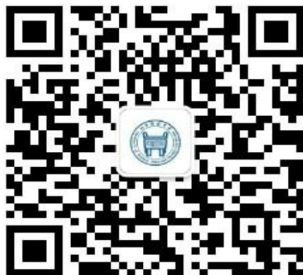
北京科技大学离退休职工工作处